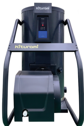
■ Напольный газовый котел серии KSG Hifin