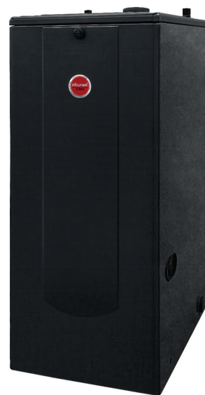
■ Напольный дизельный котел серии Turbo

о характеристиках выбранного котла, что делает процесс покупки максимально простым и прозрачным.