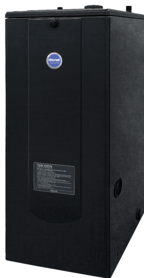
■ Напольный газовый котел серии TGB Hifin