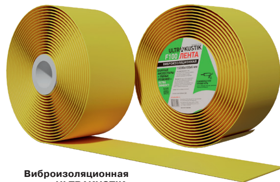
Виброизоляционная лента ULTRAKUSTIK

Например, использование 4 приведенных материалов линейки УЛЬТРАКУСТИК® с проверенной эффективностью позволяет получить не менее 9–11 дБ дополнительной звукоизоляции воздушного шума. Чтобы понять, что это значит на практике, стоит знать, что увеличение звукоизоляции на 10 дБ ощущается как снижение шума в 2 раза. Это значит, что в некоторых случаях система акустического тюнинга позволит полностью решить проблемы бытовых шумов. ◆