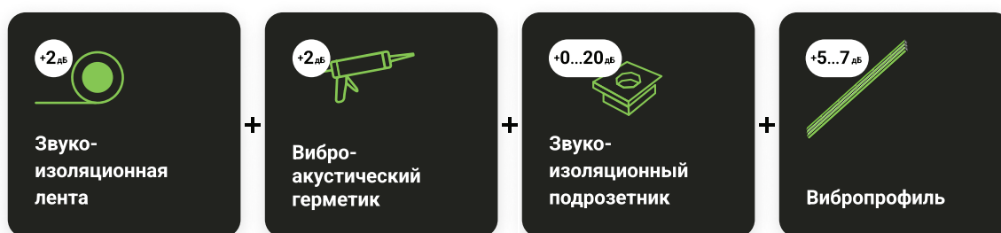
Рис. Эффективность звукоизоляции элементов линейки УЛЬТРАКУСТИК®

В Акустик Групп® была разработана концепция «акустического тюнинга» для повышения звукоизоляции гипсокартонных поверхностей под названием УЛЬТРАКУСТИК®. В практическом смысле это линейка специальных аксессуаров, позволяющих повысить звукоизоляцию стандартных гипсокартонных конструкций.