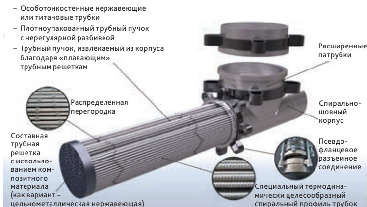
■ Рис. 2. Особенности теплообменника ТТАИ (собственные разработки)

Приведем основные научно-технические и конструктивно-технологические решения, реализованные в теплообменниках ТТАИ (рис. 2) и обеспечивающие вышеперечисленные преимущества. Решения даются без пояснений, т. к. таковые были