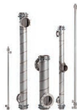
■ Рис. 1. Теплообменные аппараты ТТАИ