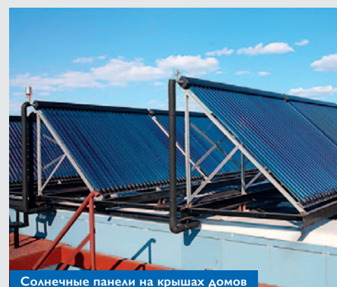
Солнечные панели на крышах домов