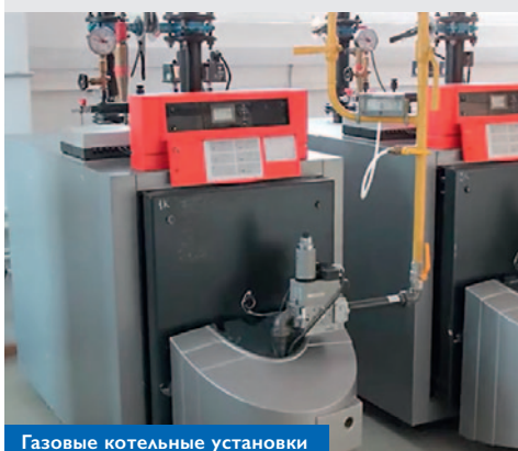
Газовые котельные установки