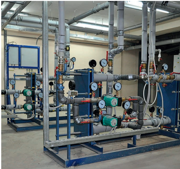
■ Рис. 1. ИТП на базе пластинчатого теплообменника