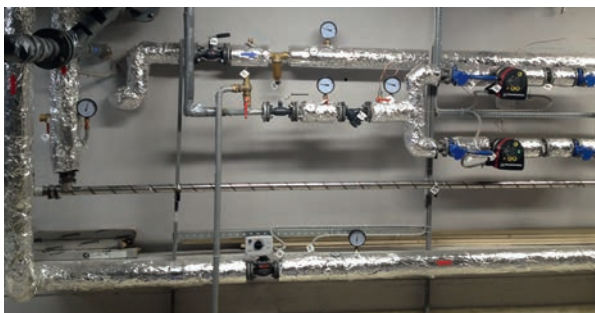
■ Рис. 3. «Планшетный» ИТП (Казань)