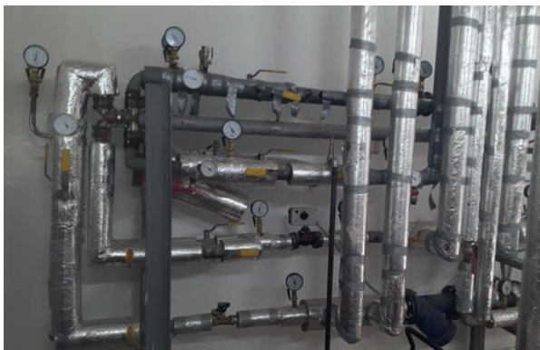
■ Рис. 4. «Планшетный» ИТП (Лыткарино)