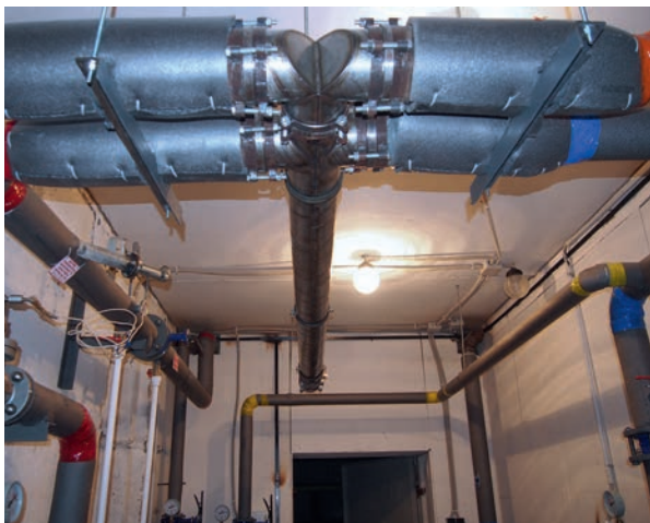
■ Рис. 5. «Планшетный» ИТП (Магнитогорск)

напоминает картину или планшет, размещенный на стене. При этом требования к размерам такого помещения снижаются в разы по сравнению с требованиями к площади помещения, в котором будет размещен ИТП с идентичными характеристиками, созданный по западноевропейской идеологии на базе пластинчатых теплообменников.