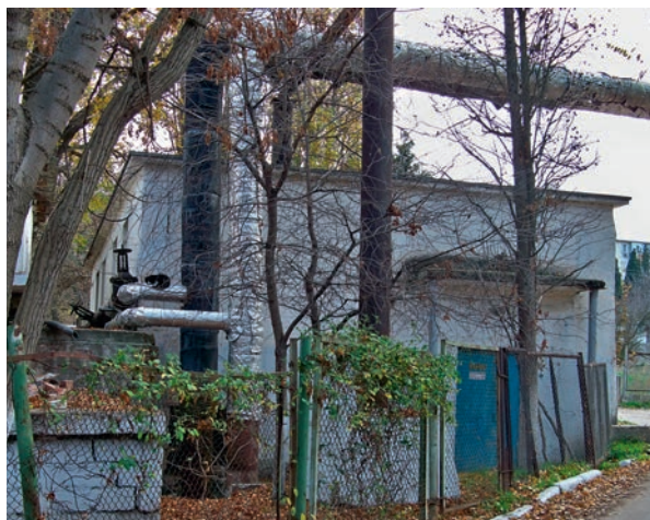
■ Рис. 6. ЦТП (Севастополь)

На рис. 2–5 представлены некоторые примеры ИТП, выполненных по «планшетной» идеологии (на рис. 5