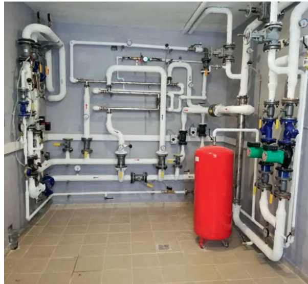
■ Рис. 2. «Планшетный» ИТП

Достаточно детальный анализ реальных и мнимых преимуществ ИТП на базе пластинчатых теплообменников и сопоставление их особенностей с особенностями