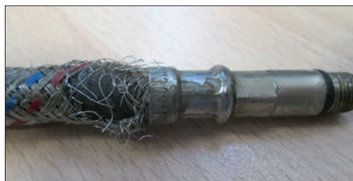
Рис. 2. Место разрыва оплетки на расстоянии 1 см до центра очага