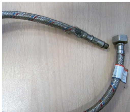
Рис. 1. Представленная дефектная подводка