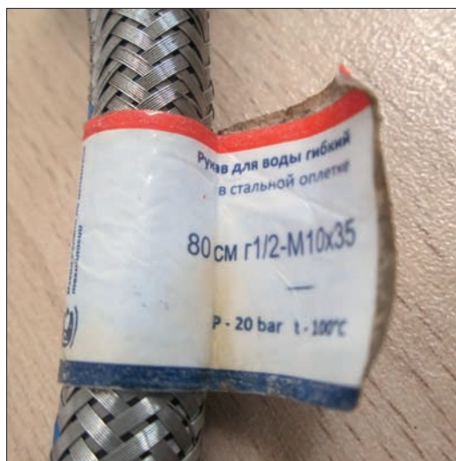
Рис. 3. Этикетка

Ø13,0 мм с обжимными гильзами и двумя вплетенными по всей длине полимерными полосками синего и красного цвета, резьбовым штуцером М10х1, накидной гайкой ½ дюйма. На обжимных гильзах отштампована фирменная маркировка: 2013.03MILL 100 °С max 20 bar. ГПВ укомплектована этикеткой, содержащей