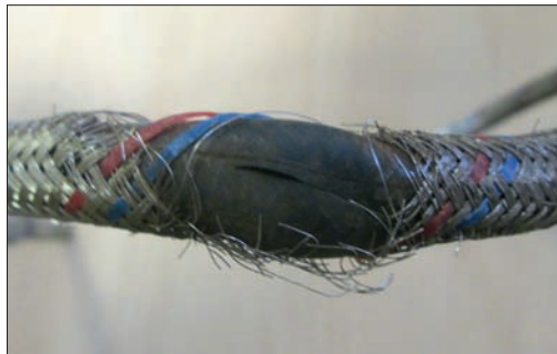
Рис. 5. Место разрыва резинового рукава

обладает достаточным запасом прочности. Как правило, детали из подобных сплавов потенциально подвержены разрушению и механизм разрыва всегда связан с наиболее слабым местом.