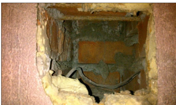
■ Рис. 2. Электропроводка и слой пенопласта внутри вентиляционного канала