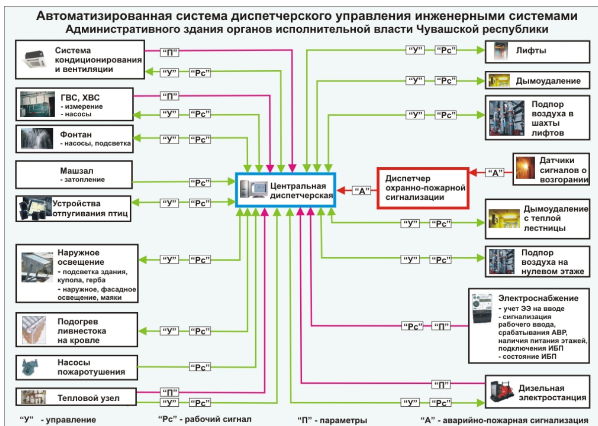
Схема АСДУ ИС административного здания ОИВ ЧР

регуляторы ECL Comfort 300, прецизионные кондиционеры UNIFLAIR; системы кондиционирования AIRSET, VRV-II, чиллеры EUWL-160 MXY фирмы «DAIKIN» и др.).